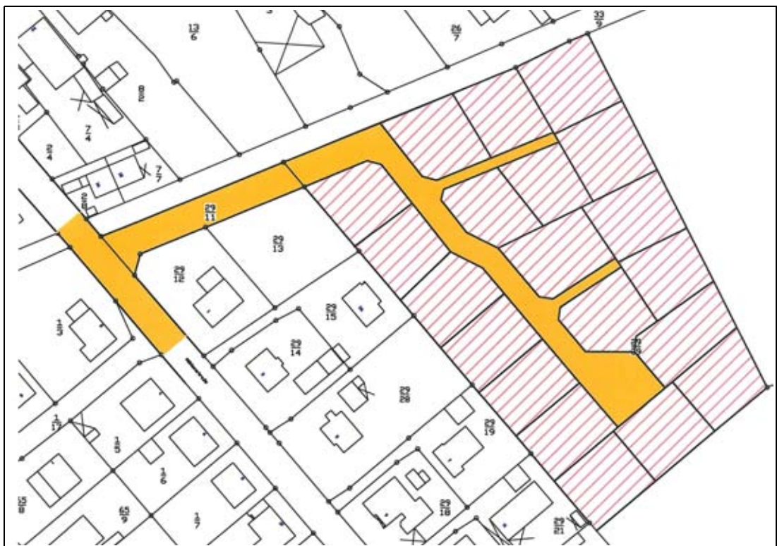
Konzeptskizze „Alter Sportplatz Altenhagen“ (ohne Maßstab)

Die nachstehende Skizze stellt ein Erschließungs- und Parzellierungskonzept dar, auf dessen Grundlage ca. 20 Bauplätze entwickelt werden können. Die Anbindung des Planbereiches erfolgt über die Mühlenstraße und wird als Anliegerstraße mit zwei Stichwegen und einem Wendehammer vorgesehen.