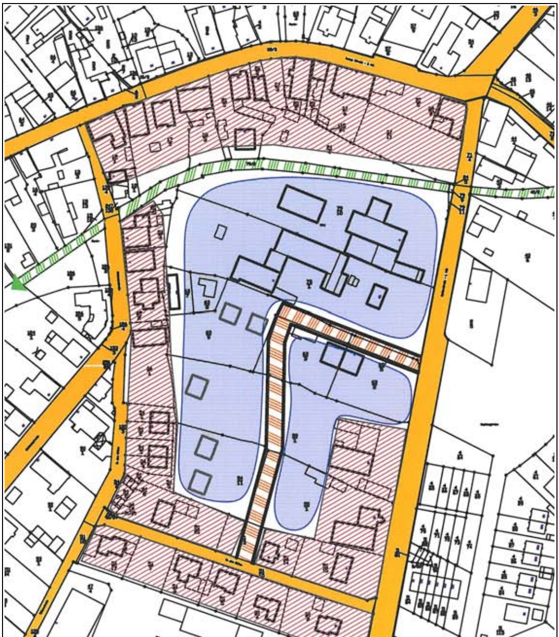
Konzeptskizze „In den Höfen“ (ohne Maßstab)

Die nachstehende Abbildung skizziert hierzu einen exemplarischen Entwicklungsansatz. Während es gilt, die vorhandene Bebauung in den Randbereichen zu erhalten und ggf. nachverdichten (rote Flächen), können durch den Bau einer internen Straße die rückwärtigen, bislang nicht nutzbaren Flächen für eine niedrig verdichtete Wohnbebauung erschlossen und neu geordnet werden (blaue Flächen). Voraussetzung für die Umsetzung dieser oder einer anderen Option ist es, eine planerische Vision für die Entwicklung dieses Bereiches zu erarbeiten und die Flächeneigentümer schrittweise in die Konzeption einzubeziehen.