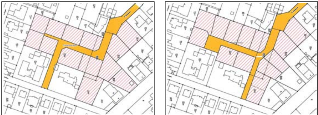
Konzepte „Trenntnerfeld“ (ohne Maßstab)

Aus ortsplanerischer Sicht wird die Nachverdichtung des bestehenden Wohngebietes zwischen den Straßen Am Torfdamm und Am Rehdamm vorgeschlagen. Hier sollten Baurechte für freistehende Einfamilienhäuser geschaffen werden. Die Erschließung des Baugebietes kann über die Verlängerung der Straße Im Wiesengrund sowie mit einer zusätzlichen Anbindung an die Straße Am Rehdamm geschaffen werden. Die beiden nachstehenden Konzeptskizzen zeigen mögliche Erschließungs- und Parzellierungsvarianten für das Baugebiet.